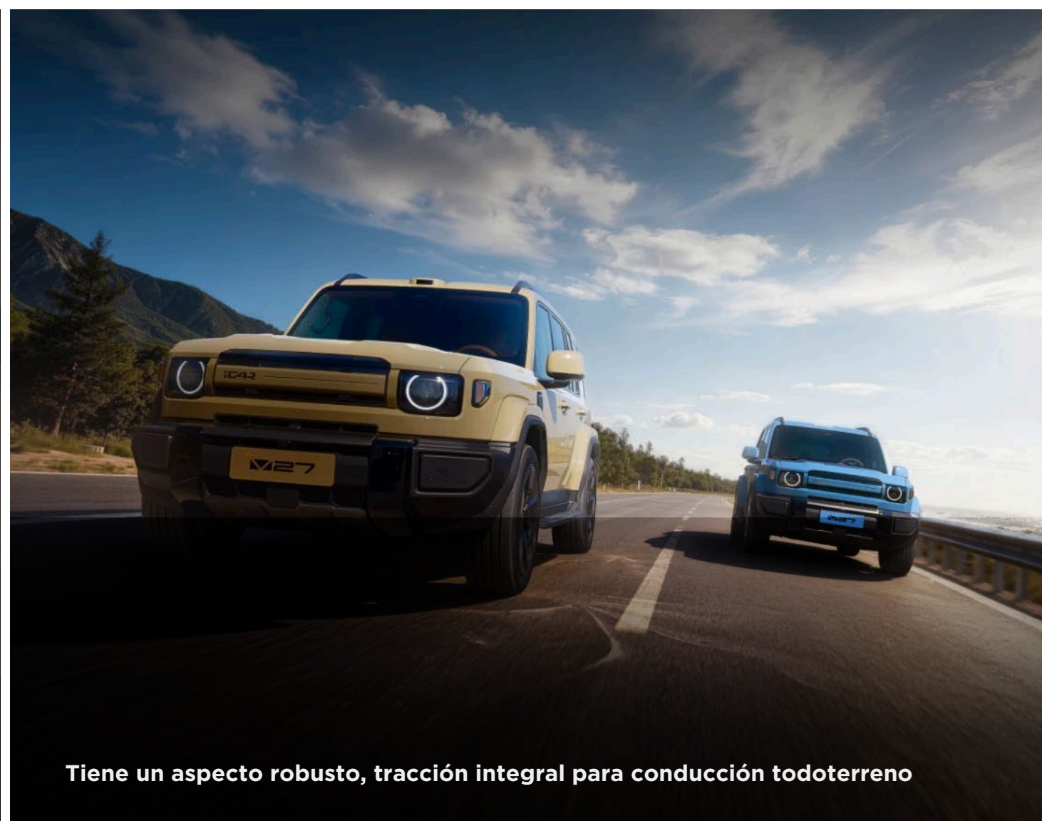
Tiene un aspecto robusto, tracción integral para conducción todoterreno