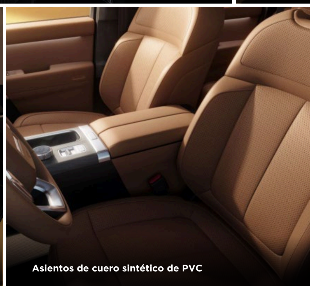
Asientos de cuero sintético de PVC