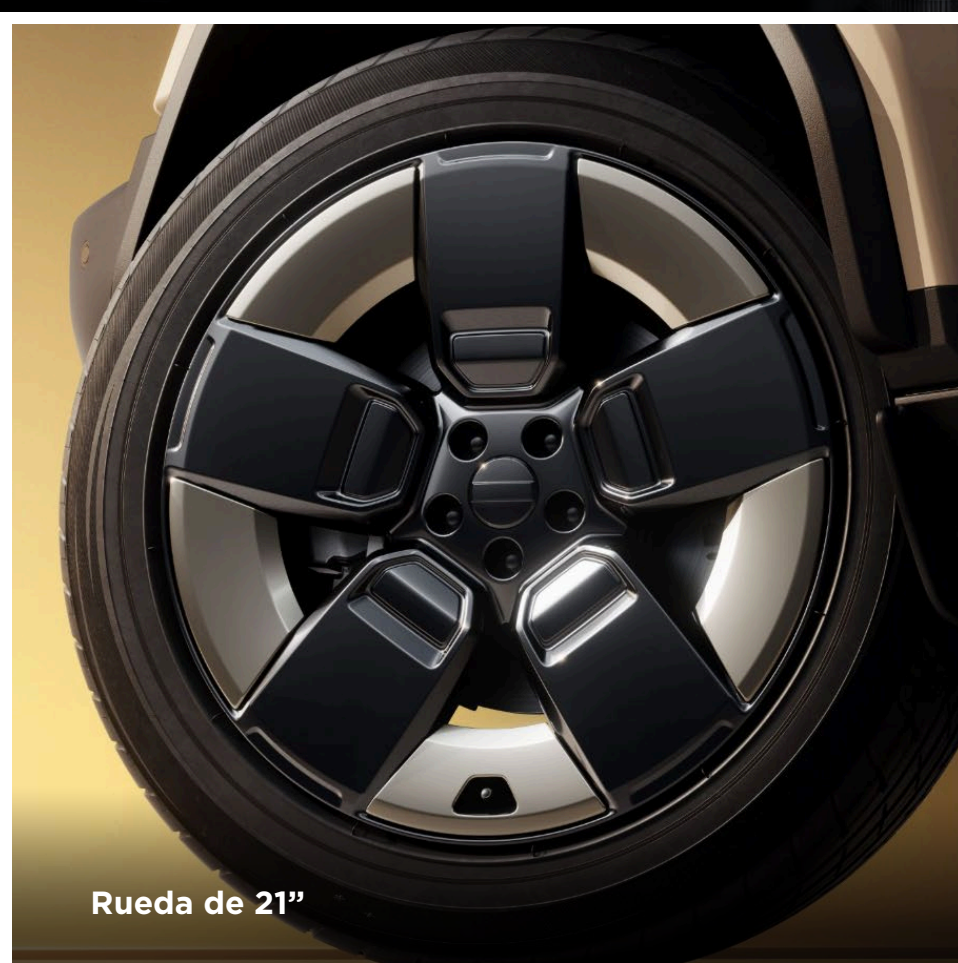
Rueda de 21"