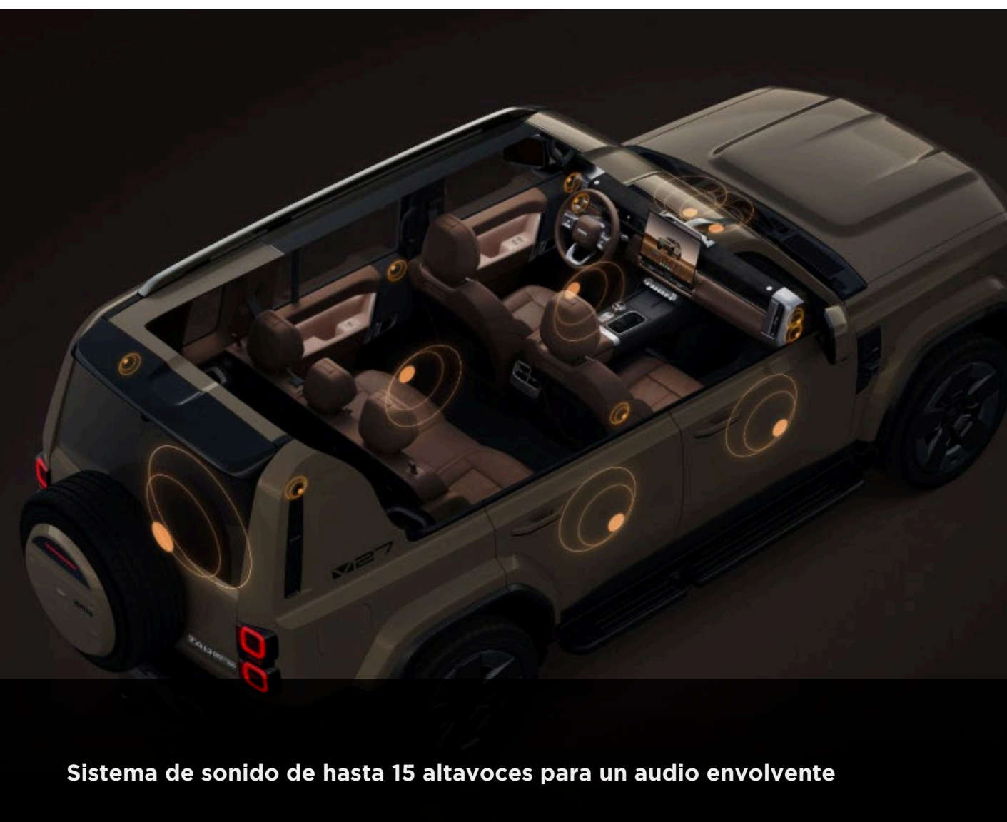
Sistema de sonido de hasta 15 altavoces para un audio envolvente