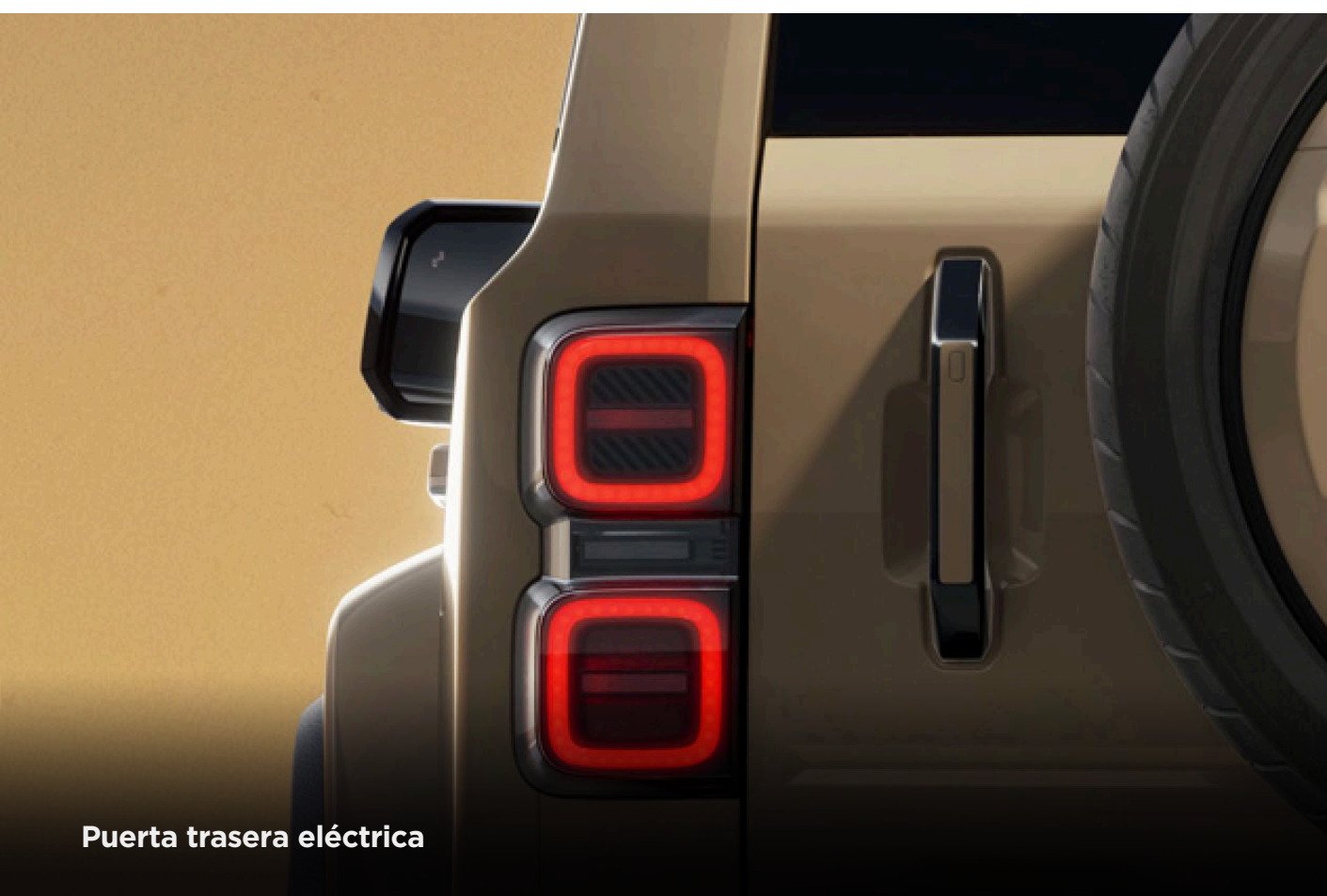
Puerta trasera eléctrica