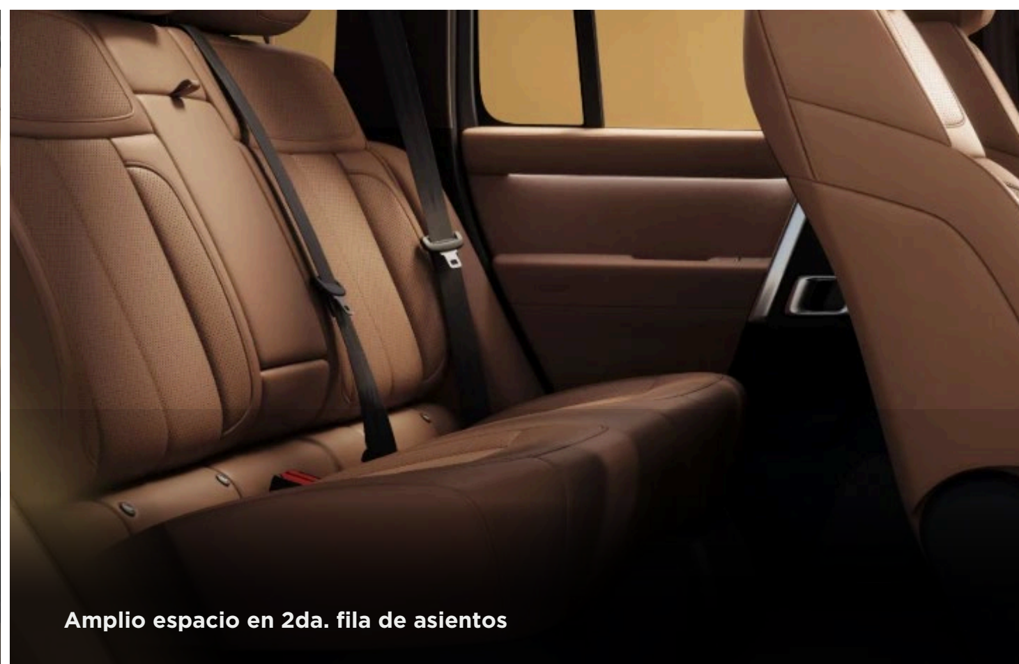
Amplio espacio en 2da. fila de asientos