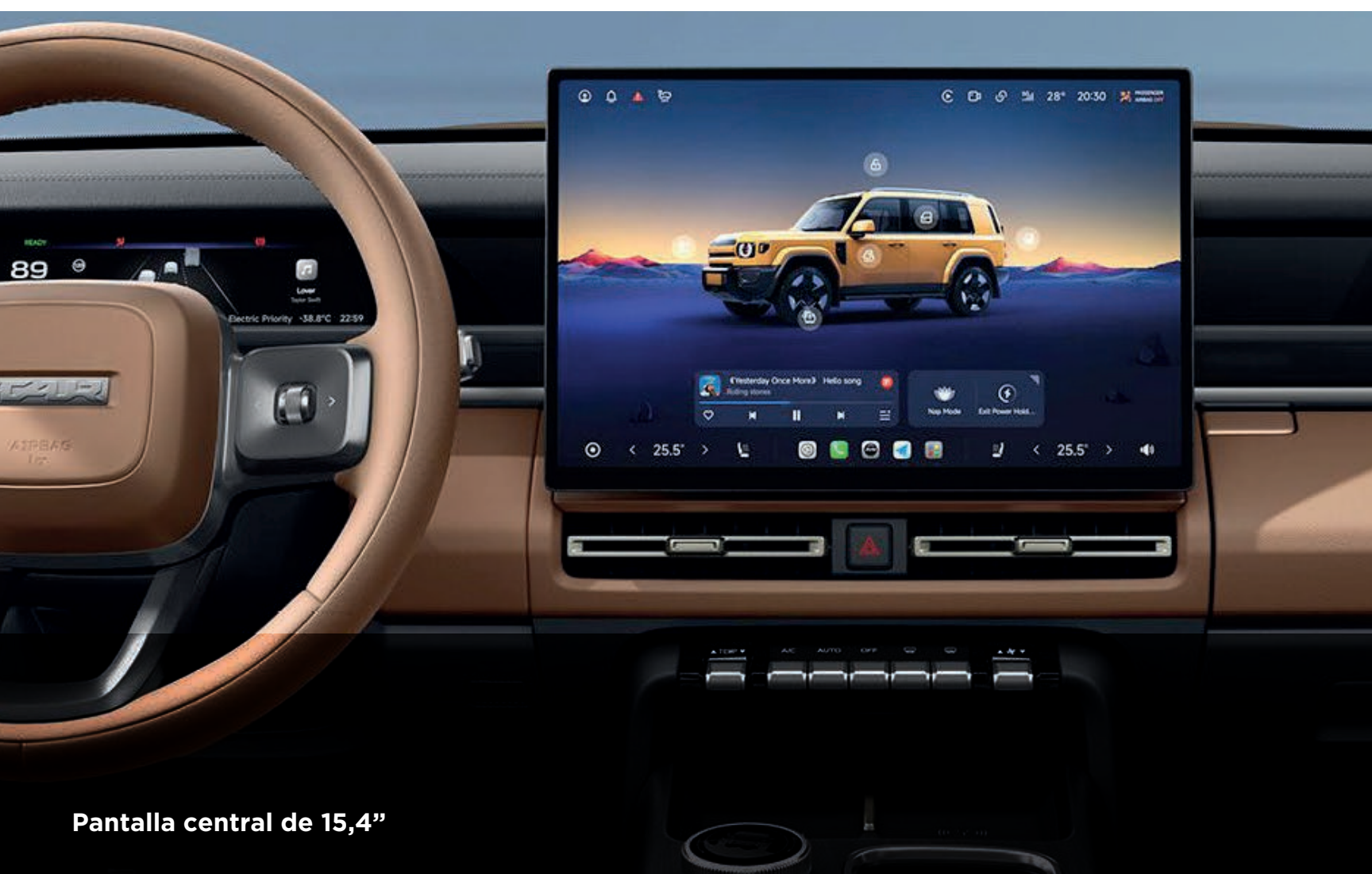
Pantalla central de 15,4"